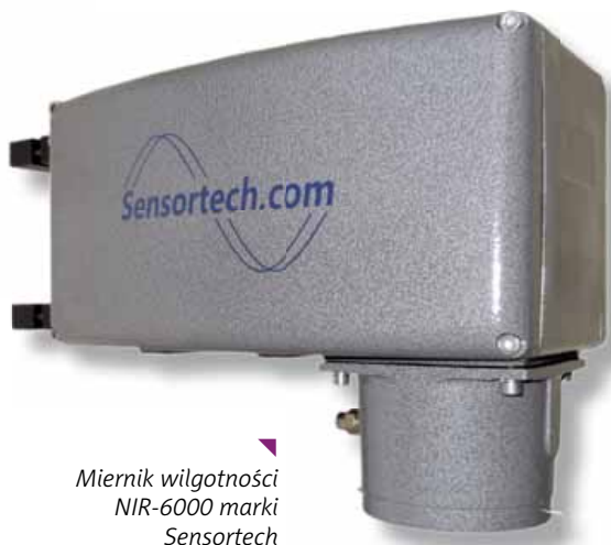
Miernik wilgotności NIR-6000 marki Sensortech

Pomiary są wykorzystywane do bieżącej kontroli jakości produktów gotowych (wilgotność mówi o tym, czy produkt mieści się w granicach specyfikacji) oraz do kontroli procesu suszenia (wilgotność na wyjściu jest parametrem wykorzystywanym do sterowania pracą suszarni). W każdym przypadku pomiar wilgotności służy osiągnięciu konkretnych oszczędności – pozwala na zmniejszenie ilości braków (produktów poza specyfikacją) przez natychmiastowe wychwycenie sytuacji